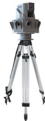
Трал Патруль 2.8 для быстрой установки