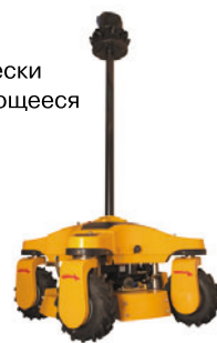
Автоматически перемещающееся шасси Трал Патруль 3