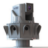
Исполнение для крепления на столбе

Система автоматического слежения прекрасно зарекомендовала себя на объектах с большой площадью наблюдения: объекты энергетической инфраструктуры, нефтеперекачивающие станции, прилегающие территории складов и заводов, парки и усадьбы. В купольном исполнении Трал Патруль 2.3 – 2.4 устанавливаются в холлах гостиниц и выставочных центрах.